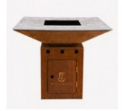
PRO LINE L