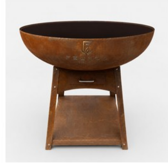
MODUL VELA L