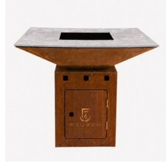
PRO LINE L