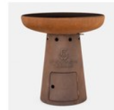
NOVA L 105