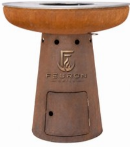
NOVA L 105

تمنح NOVA وTERRA وVEGA الحديقة تجربة نار منحوتة وراقية.