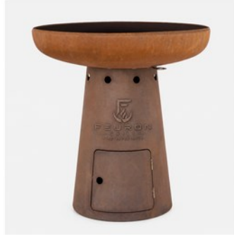
MODUL NOVA L 105