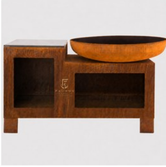
MODUL MASTER L

قواعد معيارية وإكسسوارات تمنح تجربة طهي مرنة وقابلة للتخصيص.